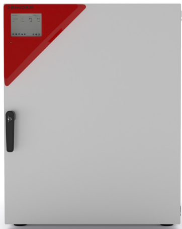
Abbildung: Modell CB 170